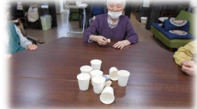
お手玉入れゲーム 紙コップの裏の点数で競います