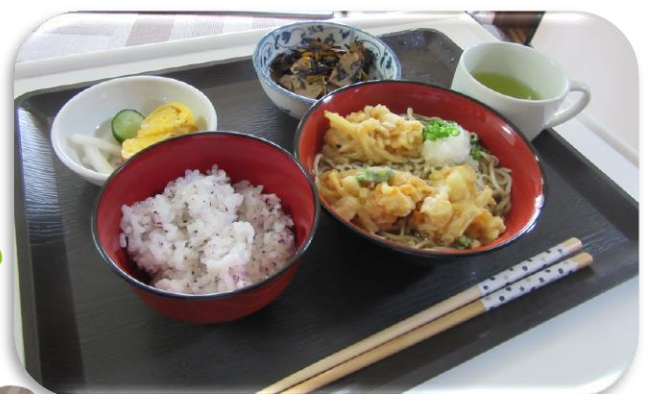
みんなのお楽しみ