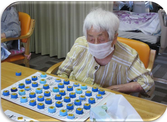
脳トレ頑張ってます♪

暑さもようやく一段落し、秋の気配を感じるようになりました。コロナウイルス感染症の収束はまだまだ見えませんが、美味しい食べ物がたくさん出てくる季節です。秋の味覚をたくさん味わって元気に過ごしていただきたいと思います。