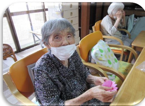
コスモスの花を作っています*