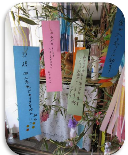
短冊にお願い事を…！