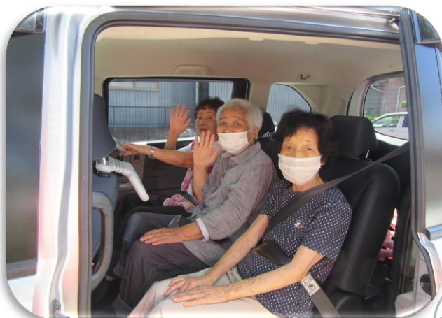
ドライブに行ってきたま〜す(^^♪