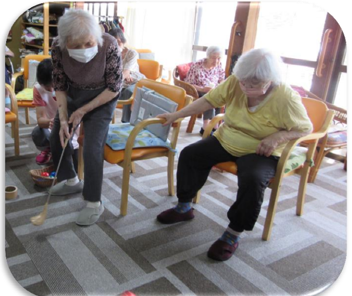
うまく打てたかな？