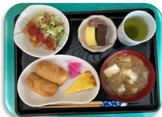
みんなのお楽しみ