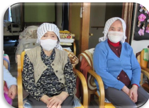
姉さんかぶりをしました。緋の着物を着たら 茶娘の出来上がり