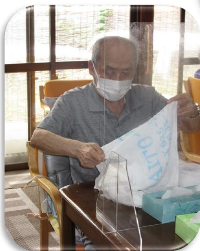
指先の訓練(タオル干し) 頑張ってます！