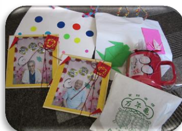
記念写真も撮りました。