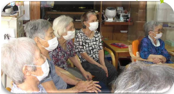
職員による紙芝居と寸劇『となりのためき』 みなさん見入っています。