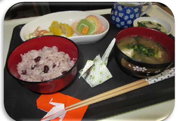
みんなのお楽しみ