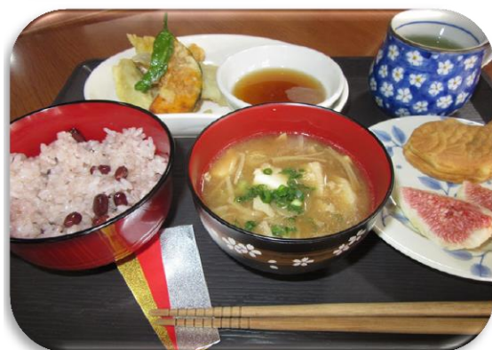
お赤飯でお祝いしました(^^)