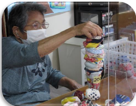
お手玉たくさん積めました。