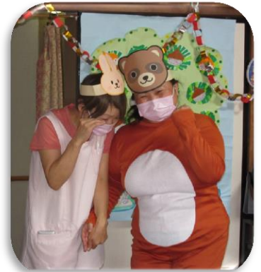
うさぎとタヌキ これからは仲良くします！