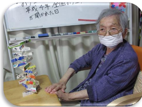
牛乳パック高く積めました。