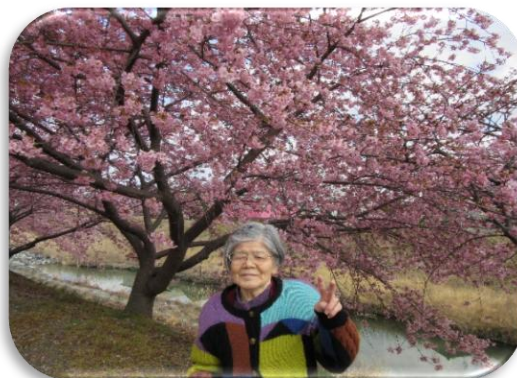
今年の河津桜 とても綺麗に咲いていました