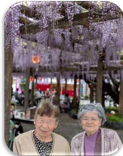
東光寺の長藤を楽しんできました