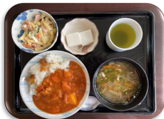
みんなのお楽しみ